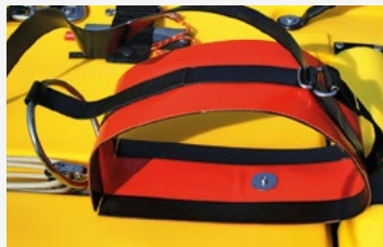
Aufzugssystem mit 4-zu-1-Flaschenzug