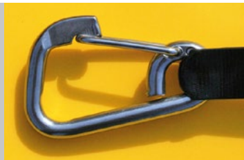
Sicherungsleine für Retter